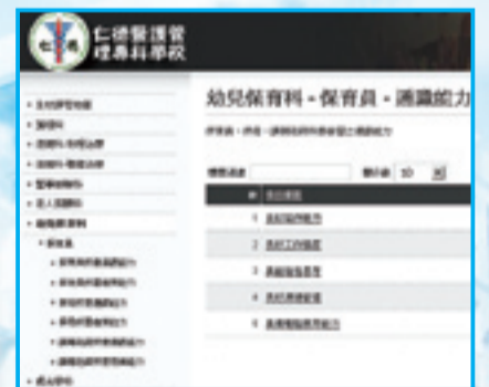
▲本校全校課程地圖網頁 →幼兒保育科查尋實例