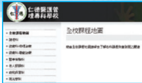
▲本校全校課程地圖網頁

通識教育雖行之有年，但因高等教育之結構性、制度性之限制，導致通識教育發展受到極大阻礙。其中通識課程出現零碎化、膚淺化的現象，而通識課程與專業課程之間因缺乏統整性的緊密連結，造成專業系所對通識教育的排斥，「重專業、輕通識」的心態普遍存在。