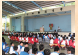
▲國中視力保健演講