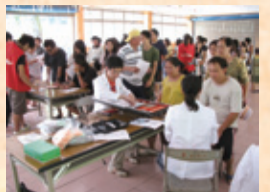
▲偏遠部落視力篩檢服務