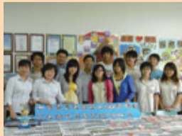
▲愛心貼捐貧童-世界和平會

(6) 本校服務性社團計有53個，98學年度辦理過服務性活動的社團有17個，辦理活動場次計46場，達到32%以上。