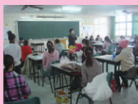
▲保母人員技能檢定