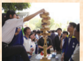
▲台中縣東華國中安全衛生推廣