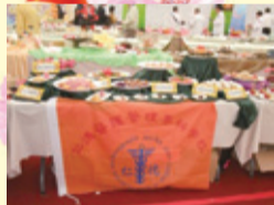
▲參賽作品榮膺團體金獎