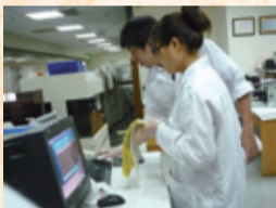
▲醫檢科學生見習各類儀器操作