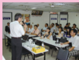
▲各地眼鏡公會講習

1. 配合業界需求，建立終身學習之教育管道： 本科於94學年度起，分別開設一般在職專班、得恩堂眼鏡公司在職專班、小林眼鏡公司在職專班、寶島眼鏡公司在職專班、學分班以及160小時非學分班等各種班別，配合業界不同需求，6年來提供業界1,419餘人在職進修之機會。