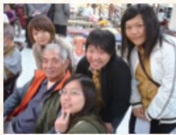
▲復健科學生參訪署苗