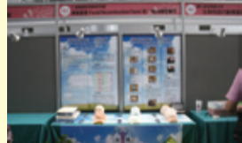
▲學生實務專題製作競賽展示場景

「顏面重建(Facial Reconstruction Form)技術—mask模型製作」項目，榮獲文語及一般科目群競選第一名，是全國唯一入選的專科學校，