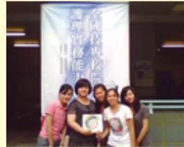
▲百萬護理知識闖關