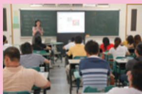
▲各地眼鏡公會講習概況

2. 舉辦「行政院勞委會眼鏡鏡片製作丙級技術士證照」術科考試流程研習會： 為倡導「眼鏡鏡片製作技術士」證照與回饋業界，科內歷年來於承辦技術士術科測試前均會舉辦多場校外研習會，以協助業界學習眼鏡鏡片製作基本操作，進而取得該項專業技術士證照，6年來，前後已舉辦近40場研習會，服務近1,100人次，以提供眼鏡業者及公會會員進修管道。