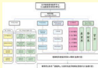
▲「99年發展學校特色典範專案計畫」執行流程示意圖