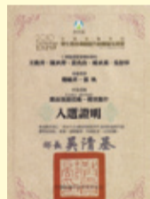
▲參加「2010年全國技專校院學生實務專題製作競賽」初賽入選證書

本校生命關懷事業科於99年6月5日參加由教育部技術及職業教育司所主辦的「2010年全國技專校院學生實務專題製作競賽」活動，從全國技專校院學生專題製作130件優良的入圍作品中脫穎而出，以