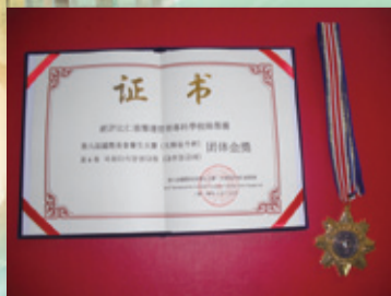
▲仁德醫專榮獲第六屆國際美食養生大賽團體金獎