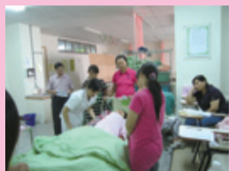
▲術科技術示教衣物更換