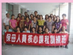
▲保母人員核心課程訓練班合影