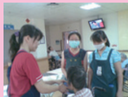
▲臨床實習正確餵食方法

本校於民國97年設置照顧服務員單一級技術士技能檢定術科考場，並陸續承接各項照顧服務員訓練計畫。今年7月由老人照顧科承辦職訓局所委託的照顧服務員訓練班，對象為失業民眾，希冀經由強化學科、術科以及實際操作的完整就業訓練後，提升求職競爭力與容易度，並達成職場就業與延續永續就業的機會。